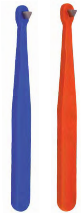
ORI-DD-164 ORI-R-DD-164N ORI-R-DD-164P

suwmiarka dwustronna do pomiarów wewnętrznych i zewnętrznych double sided for inner and outer measurements